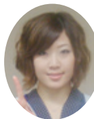
2009年3月 介護福祉専攻卒業