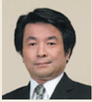
総合ビジネス学科 学科長