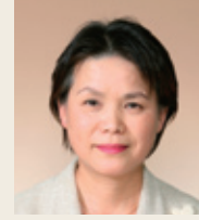
介護福祉学科 学科長

皆さんを待っている社会は複雑で多くの課題を抱えています。これからそれらに直面し多くの困難な目にあうことと思います。大きくても、小さくても夢をもってその実現に向けて常に前向きに進んで下さい。そうすればつらいことも悲しいことも必ず克服できます。また、信州短期大学で学んだこと、仲間のことを思い出して下さい。大学は卒業してからも皆さんのことを心配しています。いつでも訪ねて下さい。