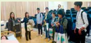
台北護理健康大学の教室見学

ずっと佐久市から出たくないと考えていた私にとって、このツアーは自分の道を揺らがせる刺激的なものになりました。