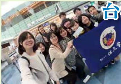
羽田空港、出発します。