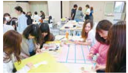
「小児看護援助論:プレパレーションを検討する」授業風景