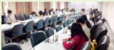
台北護理健康大学「経管栄養に対する考え」交流